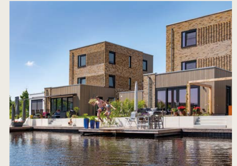
ELKE DAG. VOOR ELKAAR