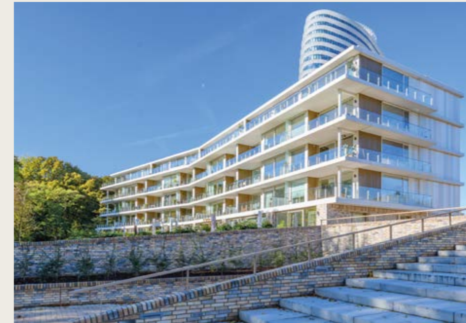
ELKE DAG. BIJZONDER

naar hoe het beter, duurzamer en slimmer kan. Creativiteit en lef zijn verweven in onze nuchtere, realistische aanpak. Elke dag weer. Zo realiseren we al jarenlang bijzondere projecten.